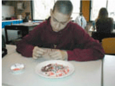
Kralen rijgen. Doek beschilderen.

Na de demonstratie van een in traditioneel Westfries klederdracht gestoken mevrouw en het bekijken van beeldmateriaal ontwerpen en maken de leerlingen naar keuze een halssieraad of -doek.